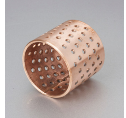
内外倒角 ID and OD chamfers