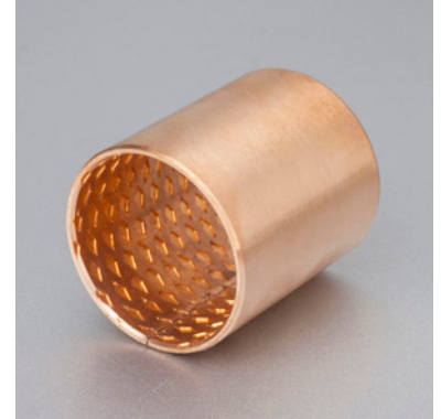
内外倒角 ID and OD chamfers